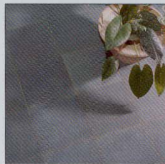
Moors Green Satino (Doc. Beltrami)