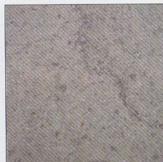
Moleanos Blue (Doc. Beltrami)