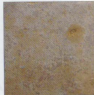
Raj Green (Doc. Beltrami)